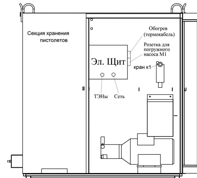
Схема расположения пункта мойки колёс